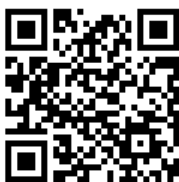
QR Code zur Anmeldung